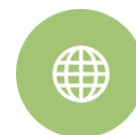
Figuur 2. Raamwerk burgerschap